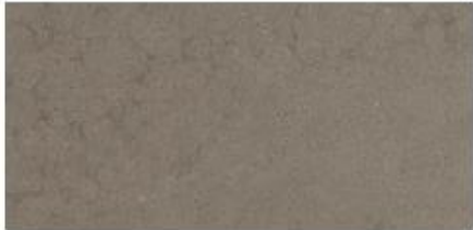
Warm Grey G40