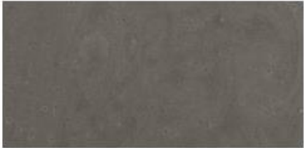
Dark Grey G60