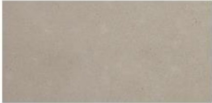
Light Grey G20